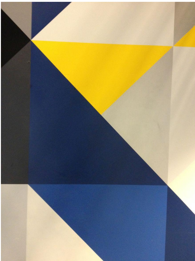
FIGUR 16. ETTER BEHANDLING.