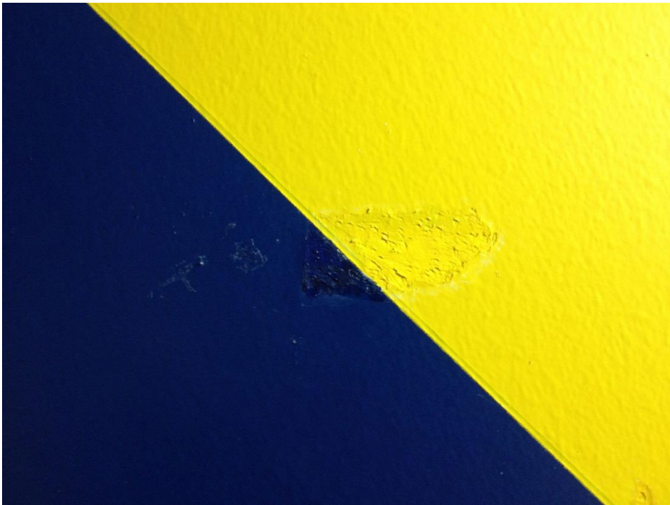
FIGUR 10. ETTER RETUSJERING. (FOTO MUR OG MER 2014).