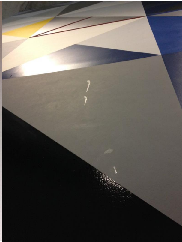
FIGUR 7. FLERE BLANKE RENNMERKER I 2,5-3 M HØYDE OVER GULV..