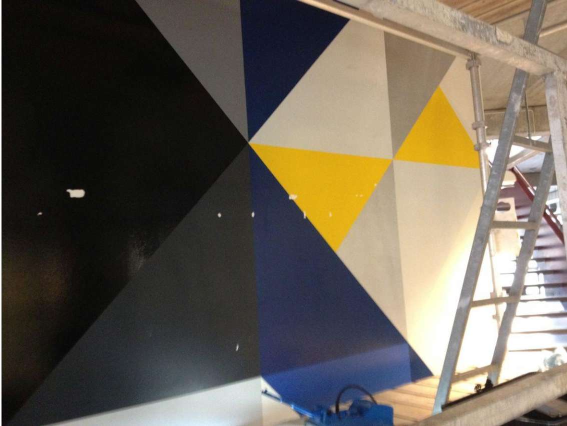
FIGUR 8. KITTING AV SKADER ETTER TAPEBRUK.

Skadene ble kittet med Modostuc, et akrylbasert reversibelt sparkel. Overflatens struktur i de reparerte områdene ble i uherdet tilstand bearbeidet og tilpasset det omgivende materialet.