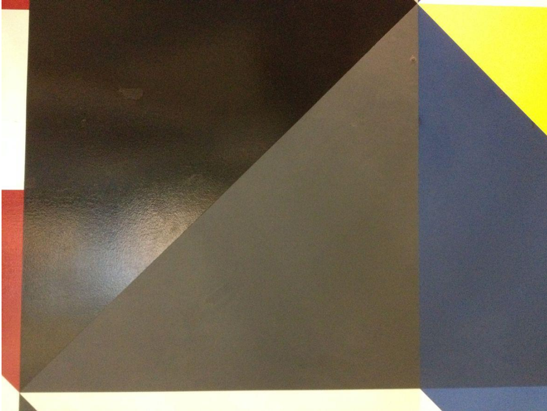
FIGUR 15. ETTER BEHANDLING. (FOTO: MUR OG MER 2014).