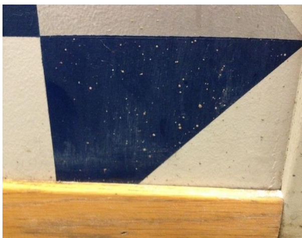
FIGUR 12. KORRIDOR SYD, FØR RENSING.