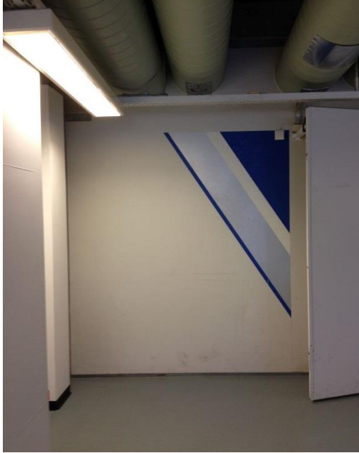
FIGUR 2. UTSMYKNING I VESTIYBYLE, SYD.

Andre elementer i utsmykningen er blant annet tilsvarende geometrisk mønstre i blått, sort og sølv på endevegg i syd mot tilgrensende korridor i 2. etasje (se fig 2.), dessuten mindre geometriske figurer på vestvegg i korridorer mot syd i 1. etasje (se fig 3).