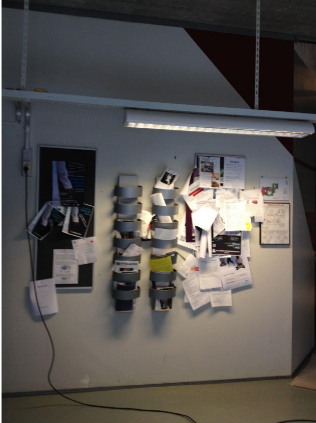
Dagens situasjon for oppslag i vestibylen. Oppslagsveggen er i direkte tilknytning til utsmykningen.