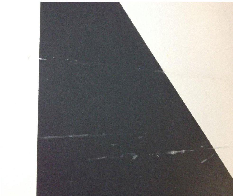
FIGUR 5. SLITASJEMERKER ETTER BELASTNING FRA MØBLER I NEDRE DEL AV MALERIET. (FOTO. MUR OG MER 2014).