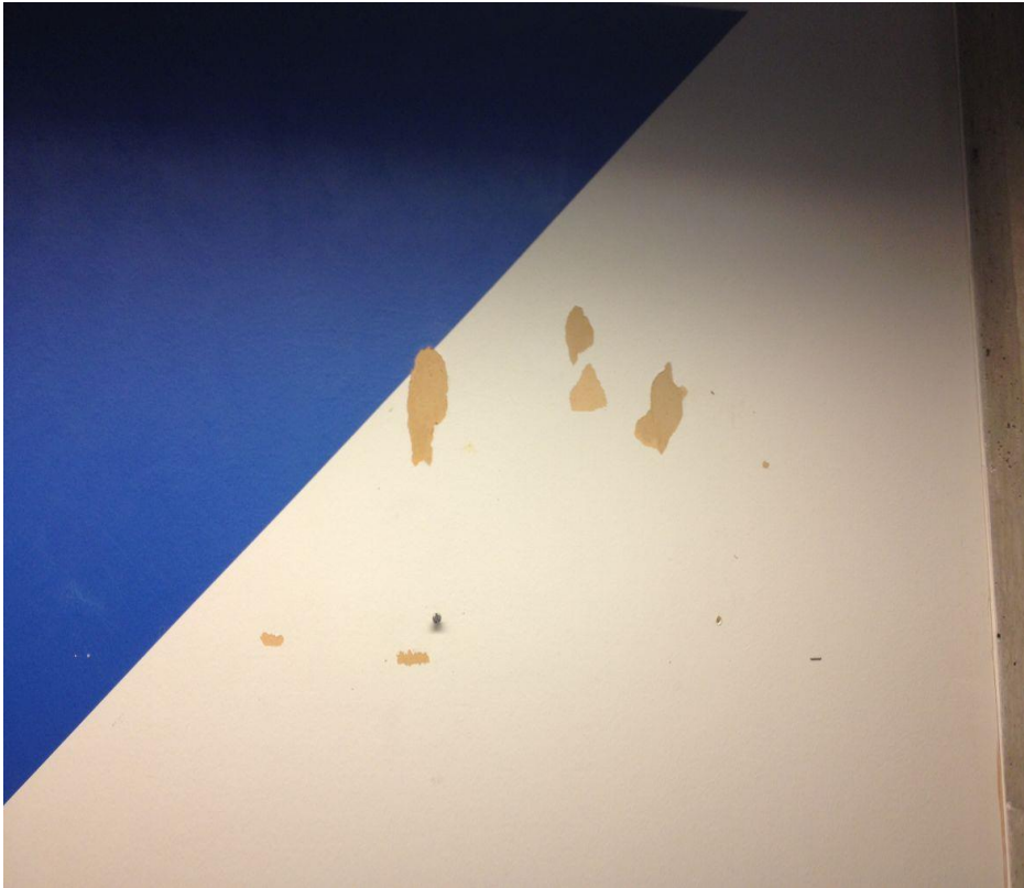
Figur 4. Avrevet malingslag og papir etter tidligere fjerning av tape fra plakattoppheng ca. 150 cm over gulv.