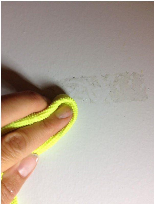
FIGUR 6. FJERNING AV TAPERESTER.