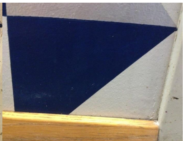
FIGUR 13. KORRIDOR, SYD ETTER RENSING. (FOTO. MUR OG MER 2014).