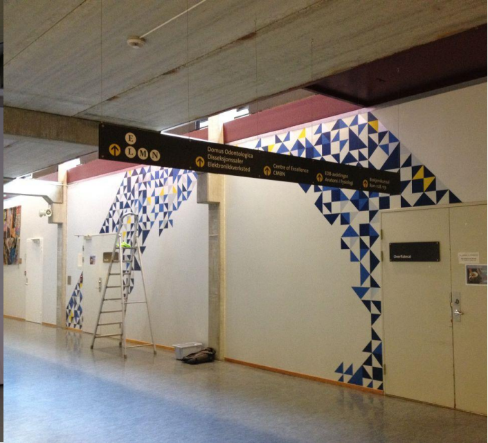
FIGUR 3. UTSMYKNING I SYDKORRIDOR, VESTVEGG.