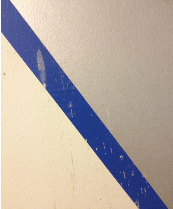
Sementsøl etter bygningsarbeider på dekoren i vestibylens sydvegg. Søllet lot seg enkelt fjerne ved tørrens.

Dekoren i korridor var skitten, forårsaket primært av rengjøring og kaffesprut. Hele veggflaten ble rengjort med nøytral såpe. Dekor i korridor hadde også blanke rennmerker, trolig av samme karakter som rennmerkene på hovedveggen i vestibylen. Heller ikke disse rennmerkene lot seg rense. Disse ble ikke dempet ned med ferniss. Det ble heller ikke gjort retusjeringer i områdene.